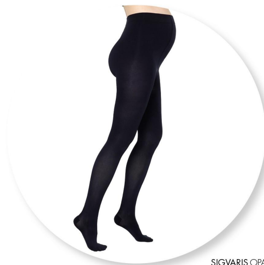
SIGVARIS OPALIS Meia calça conforto preta

A compressão médica é iniciada no dia da intervenção e continuada durante 7 a 14 dias , associada a HBPM*, conforme os fatores de risco